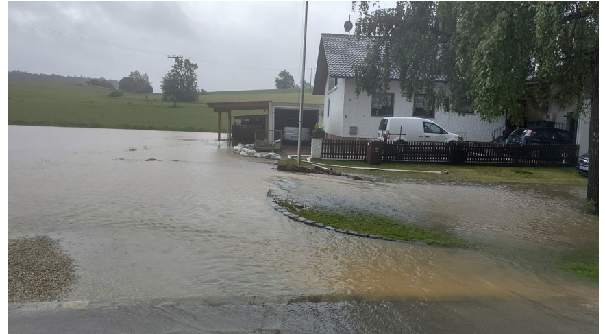
Dasinger Str. / Ringstr. /Malzhauser Str.