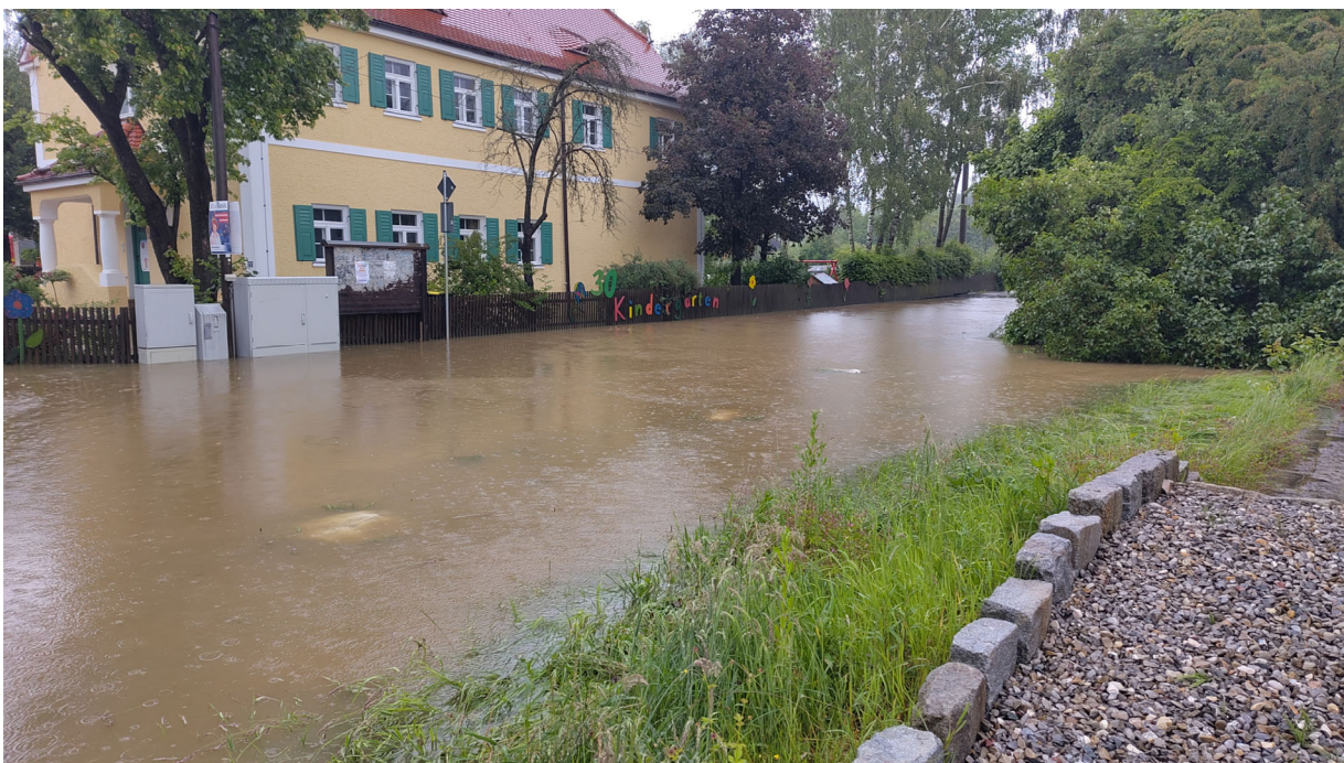
Kindergarten St. Johannes in Paar