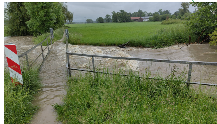
Dasinger Str. / St. Johannes-Str.