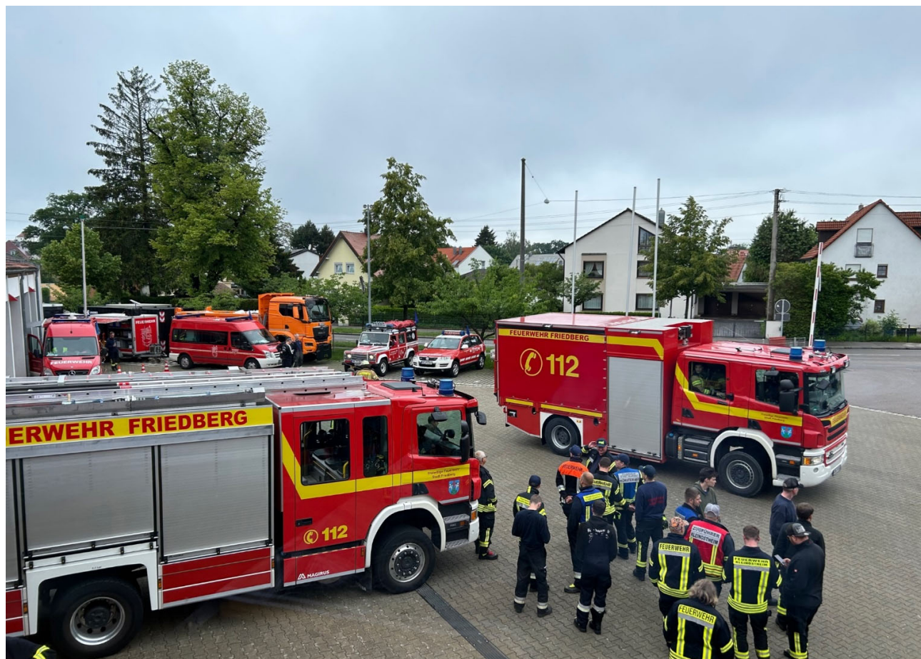
Außenbereich Feuerwehrezentrale Friedberg