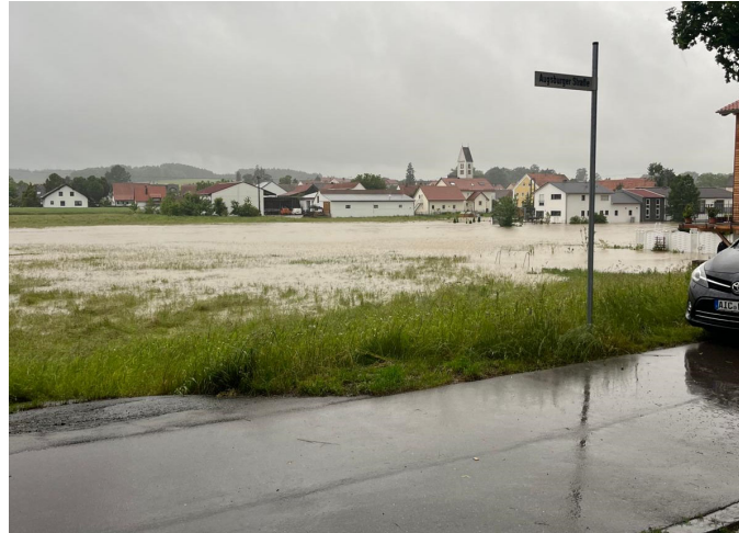
Eindrücke aus Rinnenthal