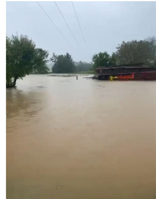
Eisbach in Rohrbach